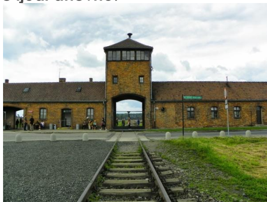
Vhodna vrata v taborišče Auschwitz– Birkenau

Druga skupina pa žal te »sreče« niso imeli. Usmerili so jih v podzemni prostor, kjer so jih pričakale lesene klopi. Zatem so ljudi usmerili v plinsko celico. Ko so te prostore napolnili, so zaprli vrata ter v posebne odprtine stresli vsebino dozo s smrtonosnim plinom. Po približno pol ure so odprli vrata in iz prostorov odnesli trupla umrlih ljudi. Na tak princip so lahko v plinskih celicah Auschwitza usmrtili tudi več kot deset tisoč ljudi dnevno .